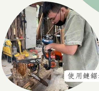
使用鏈鋸進行雕刻