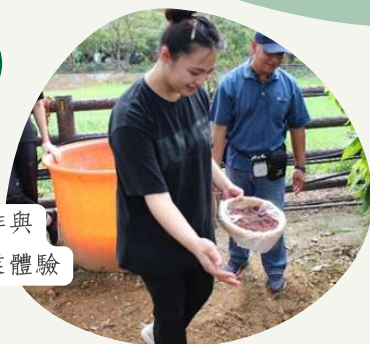
部落咖啡與 紅藜產業體驗