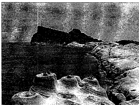
圖 2：台灣地景保育網任選一張地質公園的照片