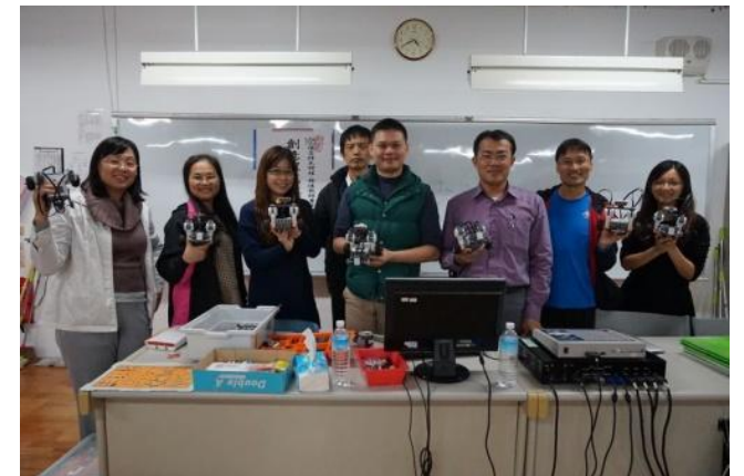
所有教師都做好屬於自己的移動式機器人。