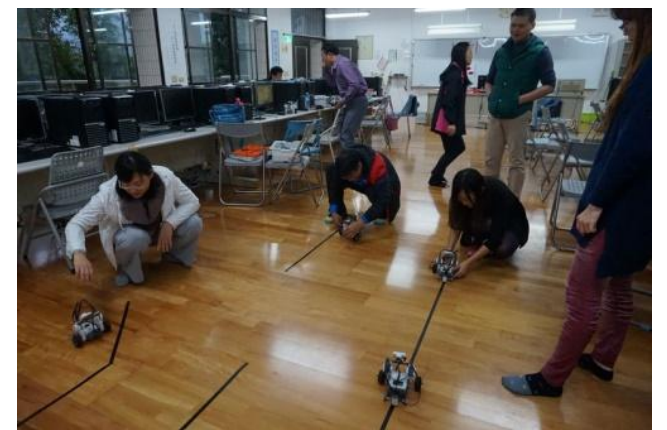
業師指導商管群教師「創意程式」編輯操作。將設計好的程式灌入機器人硬體中，使機器人能隨著程式指令做行動移動。