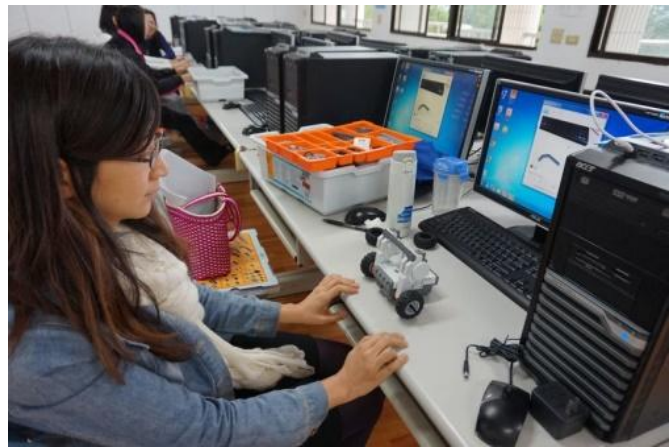
業師為商管群教師做「創意程式」軟體介紹。