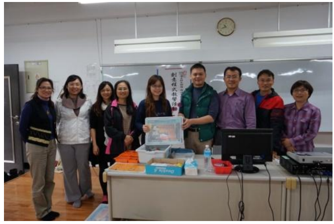
業師指導商管群教師及跨科系教師(時尚科)做「創意程式」軟體介紹。