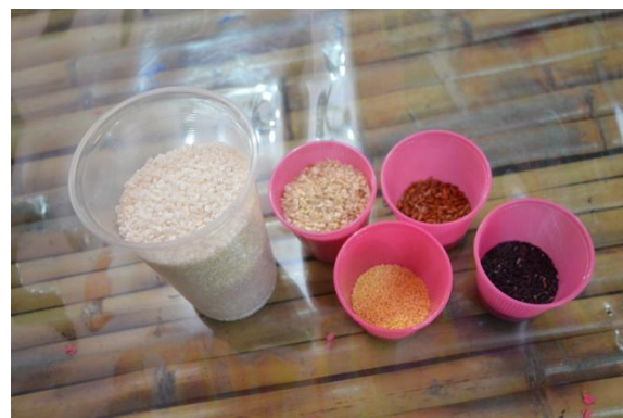
春日生產的有機米糧類