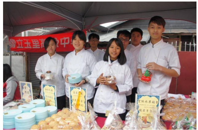
希望天然可口的麵包蛋糕能點亮您的心