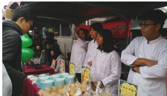
學生與社區人士互動交流