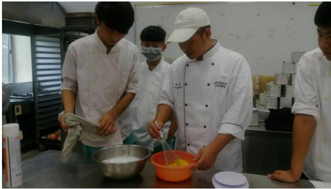
周老師正在教學生製作聖誕蛋糕