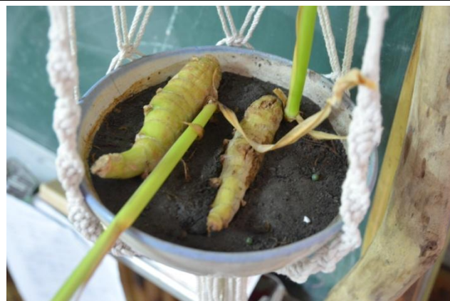
自然的澱粉來源、阿嬀們的太白粉-葛鬱金