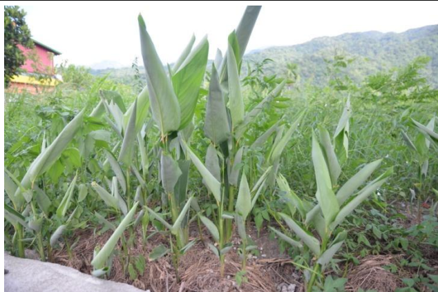
部落中的葛鬱金田