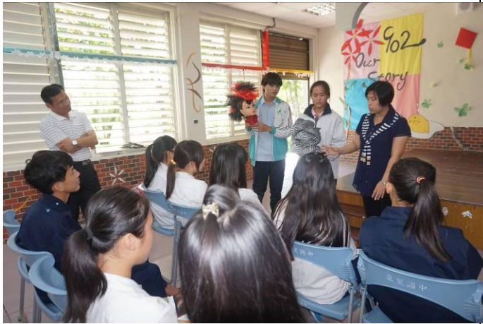
105.5.18 東里國中特色宣導