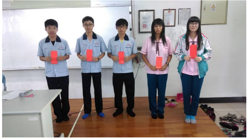
學生領取獎學金合照