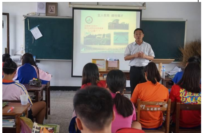
105.5.23 玉東國中特色宣導