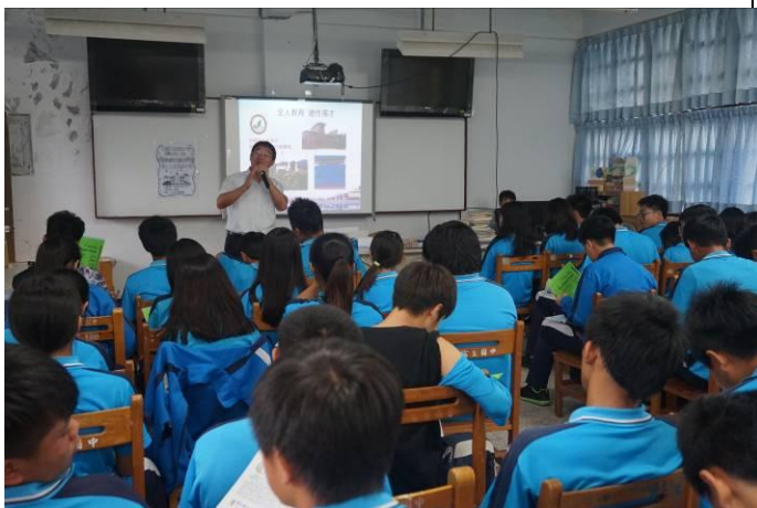
105.5.19 富里國中特色宣導