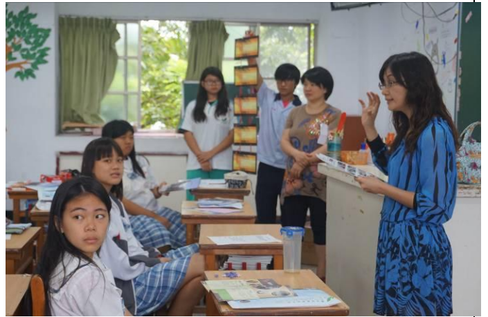
105.5.19 玉里國中特色宣導