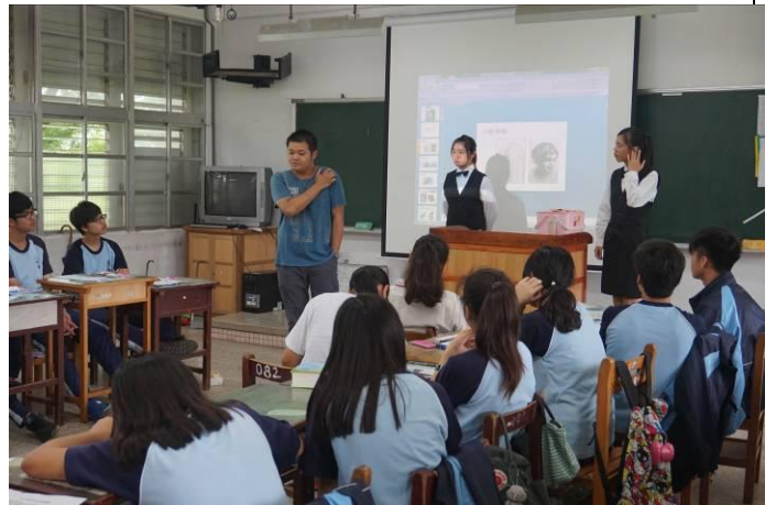
105.5.24 富源國中特色宣導