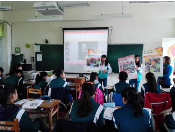
105.3.17 富北國中特色宣導