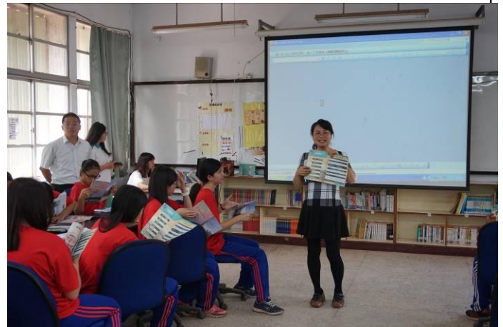
105.4.7 三民國中特色宣導