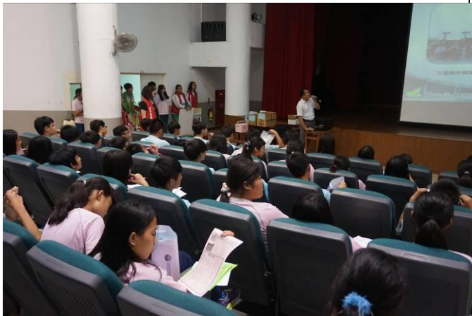
105.5.23 瑞穗國中特色宣導