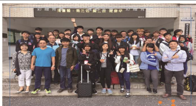
快樂出門、平安回家！出發前在行政大樓前來張大合照