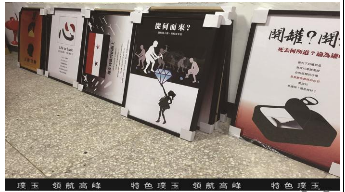
璞玉 領航高峰 特色璞玉 領航高峰 特色璞玉