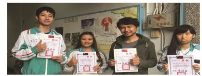
學生參加105學年度全國學生美術比賽花蓮縣初賽榮獲佳績