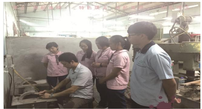
周(三)下午的玉石研磨社團課開放給全校有興趣的同學選修