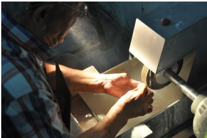
業師示範研磨技巧