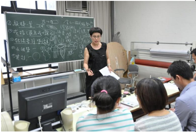
講師講解玉石鑲嵌的各種方式