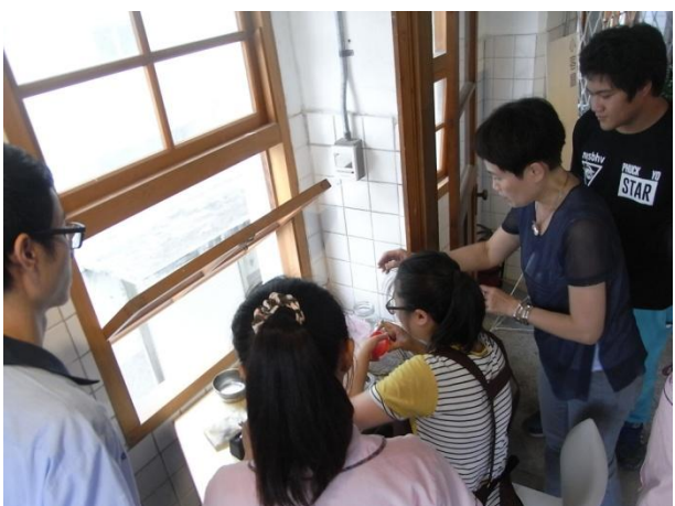
講師與助教協助同學焊接