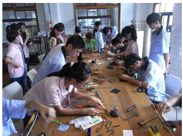
同學們努力完成作品