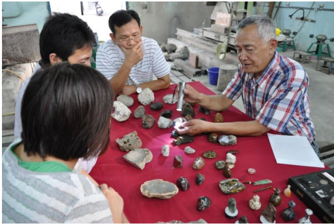
業師講解各式玉石的特色與概念