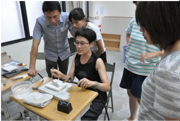
講師教導教師們如何退火