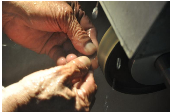
業師示範研磨造型的方式