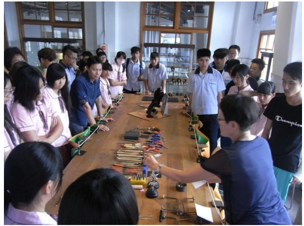
各式工具講解分析