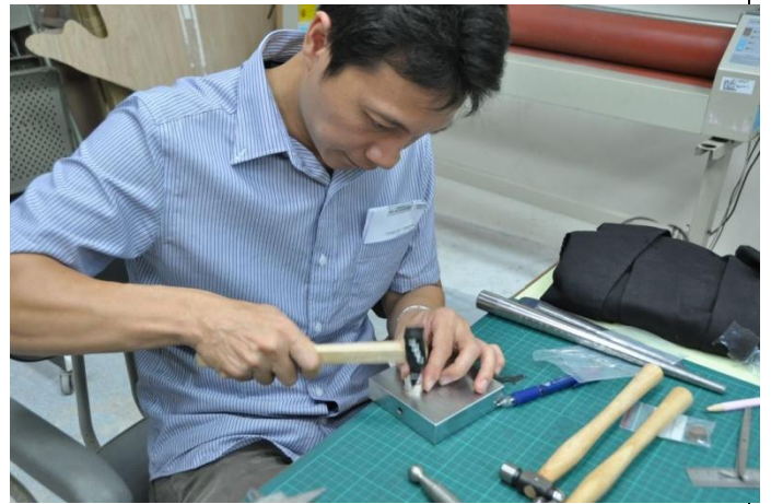
教師們實際操作演練