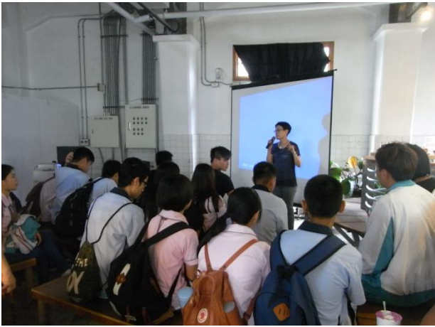
講師講解銀材料的特色與概念