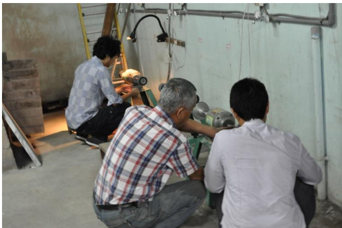
教師實際操作，講師在旁解惑