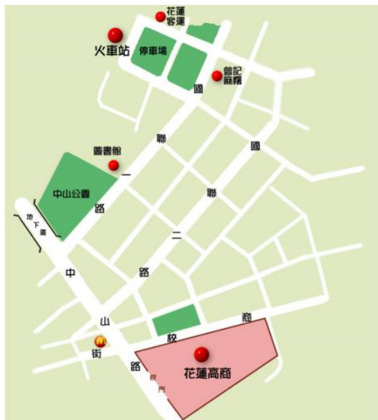
附圖一 承辦學校國立花蓮高級商業職業學校位置圖